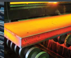
Traitement thermique et traitement de surface