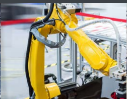
Fabrication et design de machines sur mesure