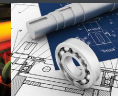
Ingénierie et services techniques industriels