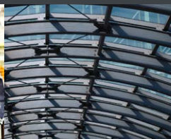
Structures et plaques métalliques