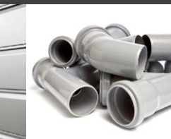
Plastiques et composites